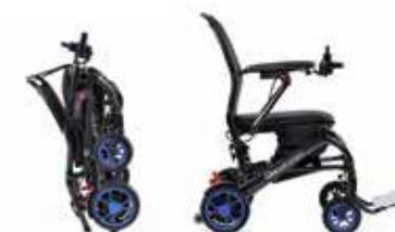
Q50 R Carbon

Silla de ruedas plegable de carbono, con batería de litio.