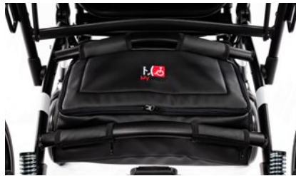
Bolsa bajo asiento