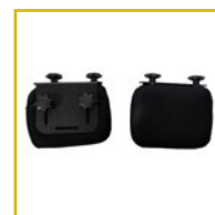
Incluye protectores laterales, controles torácicos, cefálicos y pélvicos.