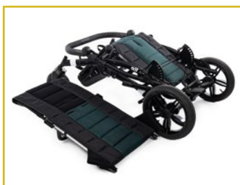
Estructura plegable y desmontable en 2 partes